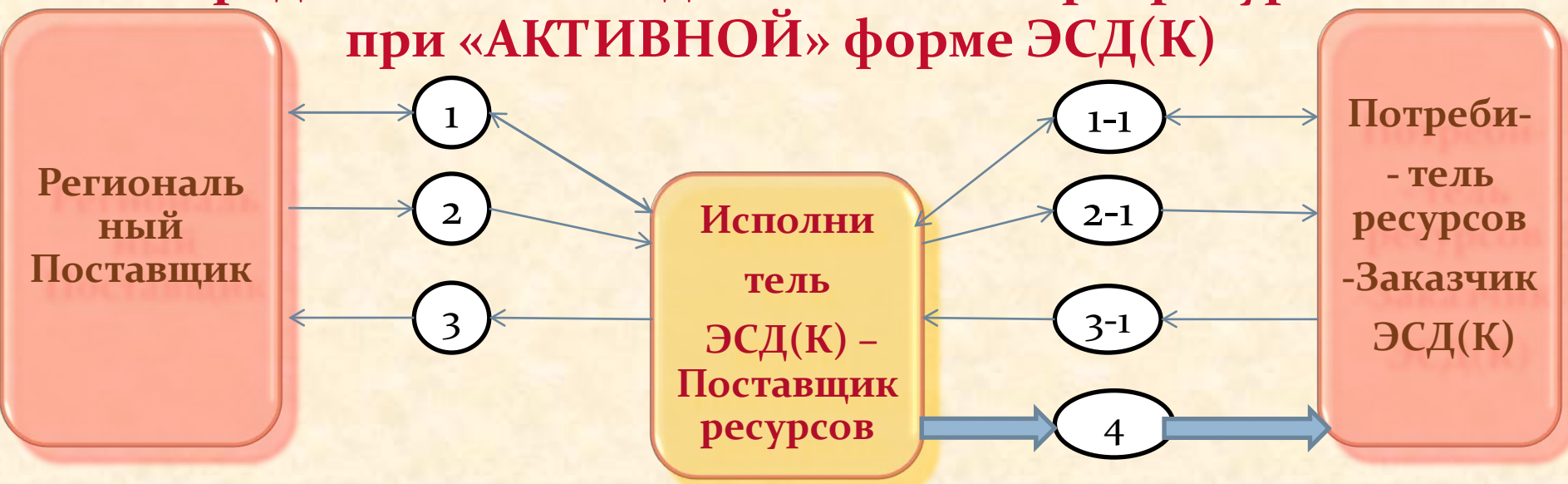
Схема документооборота и накопления средств, предназначаемых для оплаты энергоресурсов при «АКТИВНОЙ» форме ЭСД(К)