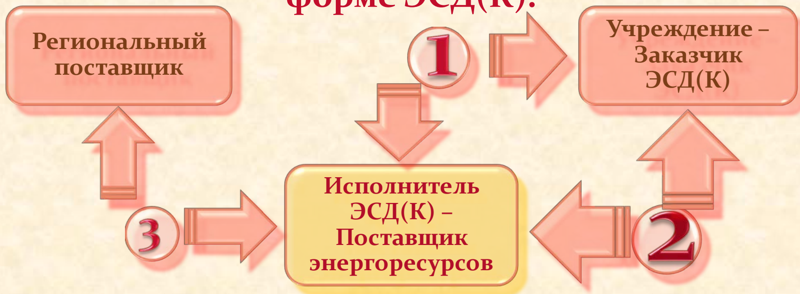
Схема договорных отношений при «АКТИВНОЙ» форме ЭСД(К).